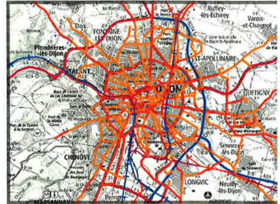
Zoom sur Dijon