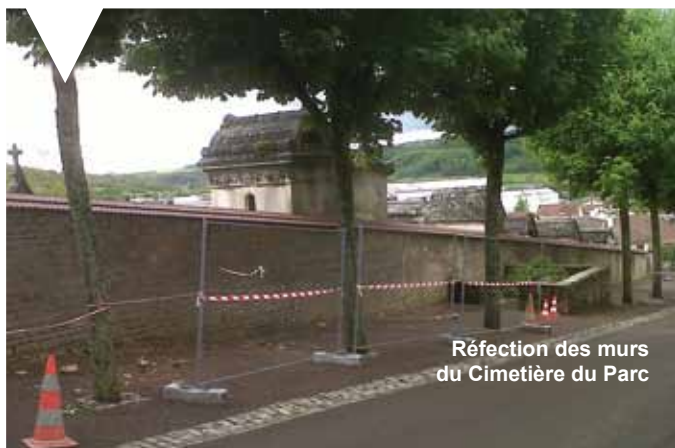
Réfection des murs du Cimetière du Parc

Depuis de nombreuses années ces murs se dégradent un peu plus chaque jour. La subvention accordée par l'Etat, a permis à la collectivité de pouvoir enfin intervenir sur cette partie du patrimoine de la ville.