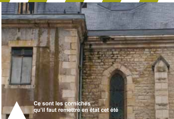
Ce sont les corniches qu'il faut remettre en état cet été