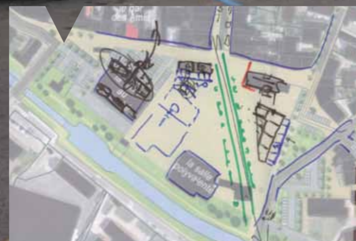
Les deux hypothèses imaginées lors de l'atelier, par les deux groupes de Montbarlois.