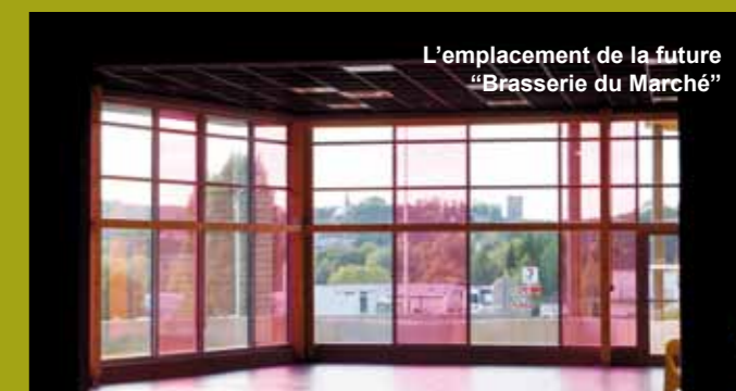
L'emplacement de la future "Brasserie du Marché".