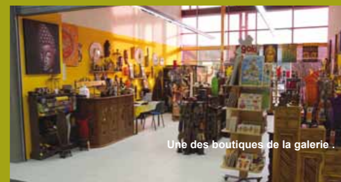
Une des boutiques de la galerie.