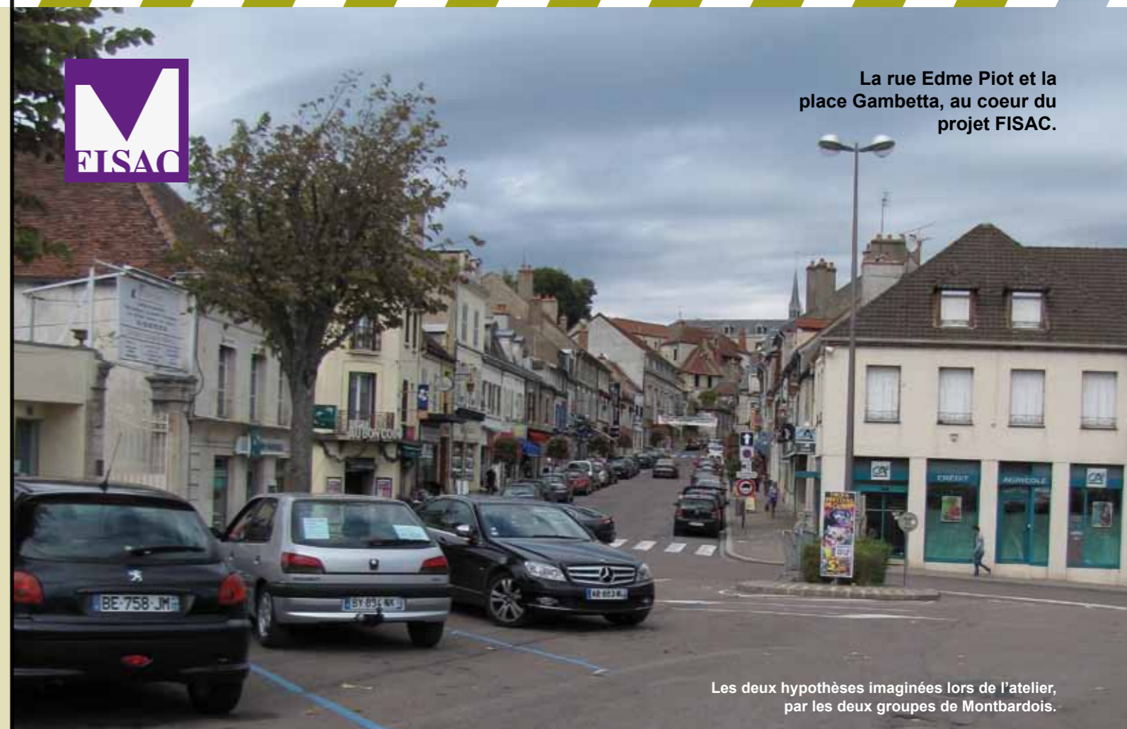
La rue Edme Piot et la place Gambetta, au cœur du projet FISAC.