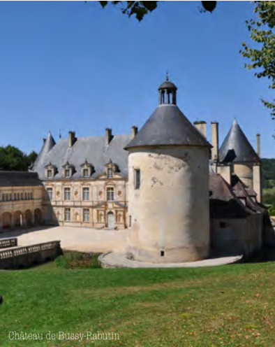
Château de Bussy-Rabutin